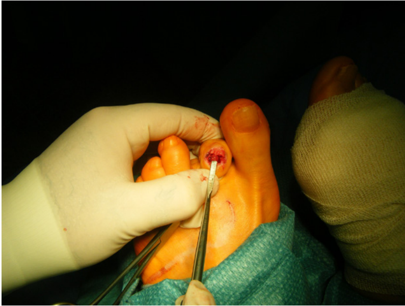
Slika 2: Zatič – fotografija med operacijo.

zašijemo v eni ali dveh plasteh. Zunanji del igle, pred prstom, ukrivimo in prst zaščitimo s prevezo. Bolnik dobi navodila glede obremenjevanja, obutve in zaščite stopala. Kontrolne preglede in prevezovanje opravi bolnik v zdravstvenem domu, kontrolni pregled pri kirurgu, ki ga je operiral, pa po 6 tednih. Odstrani se KI, rentgensko preveri zraslost kosti, bolnik pa dobi še navodila glede nadaljnjih prevez, kontrolnih pregledov, obremenitev in obutve.